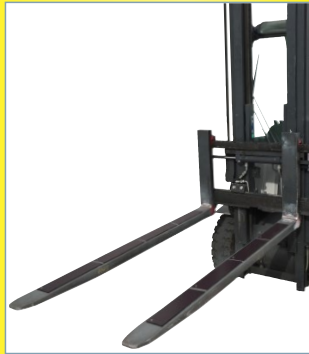
Für höchste Gabelstapler-Verladesicherheit