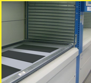
Für Umlaufregale, Blech-Tablare und Lagersysteme