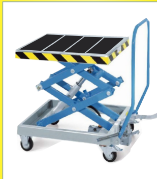
Für Hubgeräte und Hebebühnen aller Art