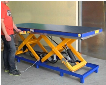
BCP-HPR Fahr- und Hubtische