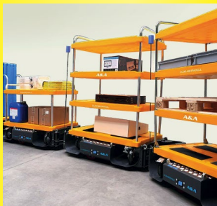
Für Routenzüge und fahrerlose Transportsysteme